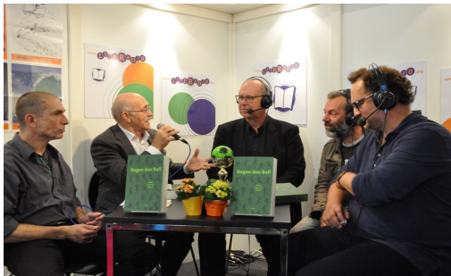
Präsentation auf der literadio Bühne auf der Frankfurter Buchmesse 2017 Gegen den Ball. Wenn Autoren kicken.

Auch 2017 wurde in bewährter Weise live vom Messestand der IG Autorinnen Autoren übertragen. Das literadio - Studio ist für alle MessebesucherInnen einzusehen, durch die offene Bauweise des Messestandes erscheint es den Betrachtern eher als Bühne denn als Studio. Stühle laden Interessierte zum Zuschauen, Zuhören und Mitwirken an dem Geschehen im literadio - Studio ein.